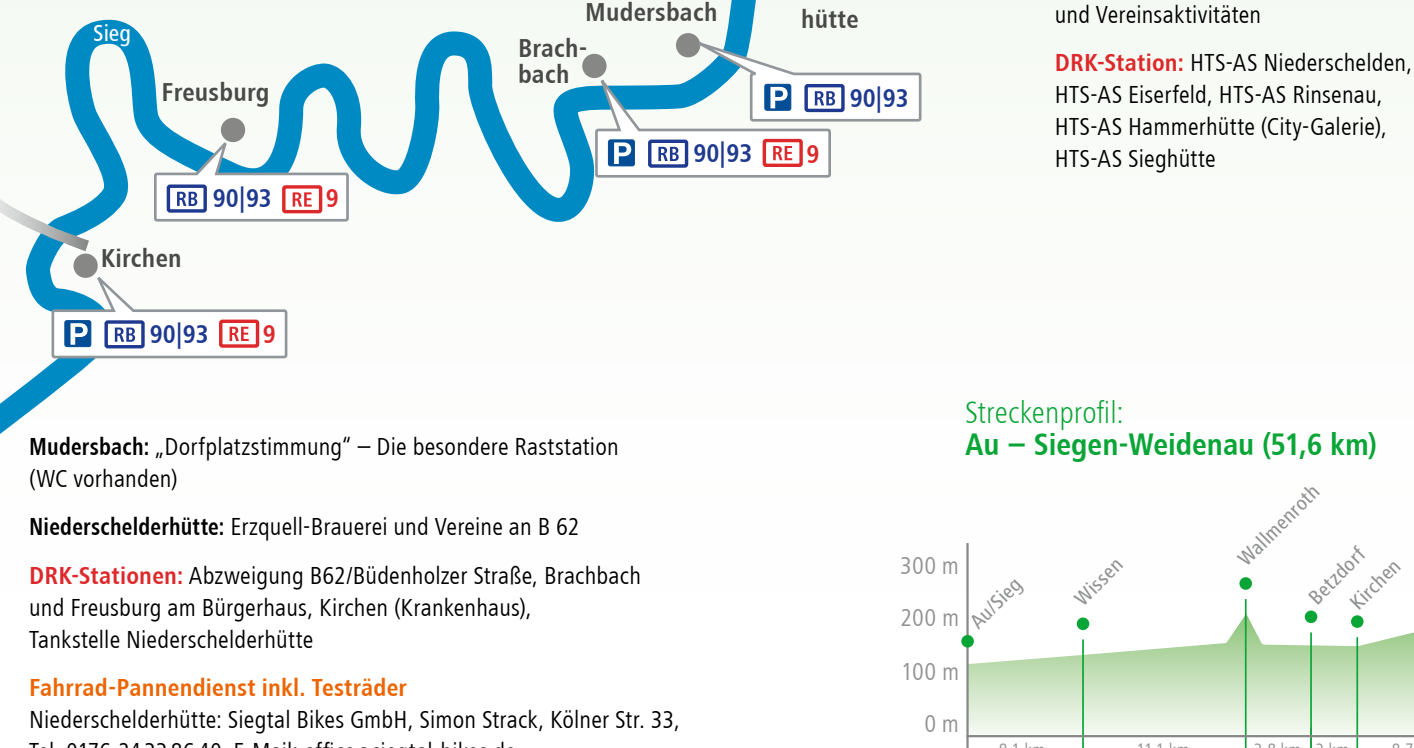
Streckenprofil: Au – Siegen-Weidenau (51,6 km)